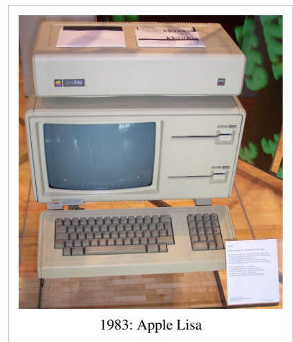
1983: Apple Lisa